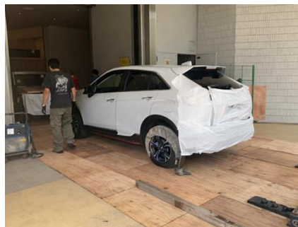
タイヤカバーをつける