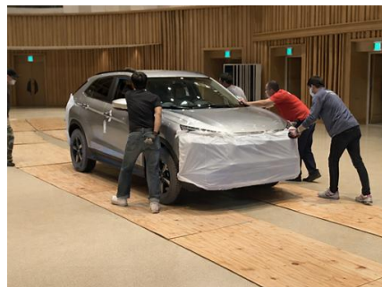
展示位置へ設置完了 ※タイヤ下に敷物をひく