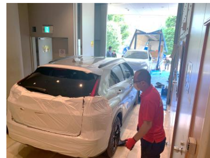
手押しでホールへ