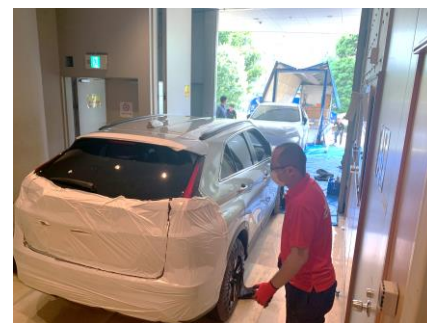
手押しでホールへ