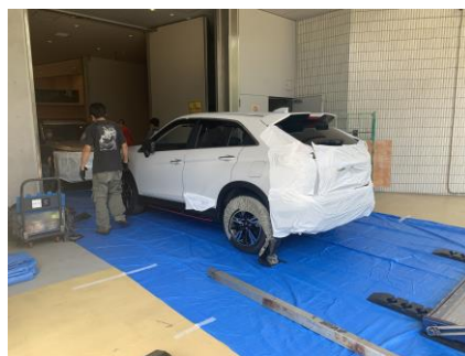
タイヤカバーをつける