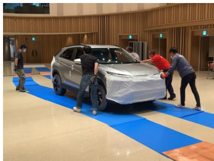
展示位置へ設置完了 ※タイヤ下に敷物をひく